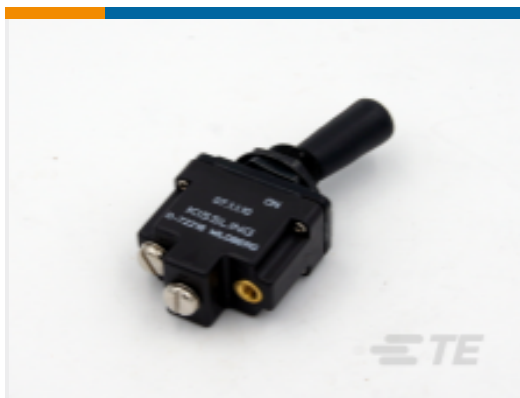
TE 产品编号K1007153 Toggle Switch 08-1-1-13