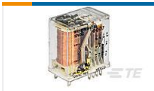
TE 产品编号8-1393766-6 R10-E1Z6-V430=R10