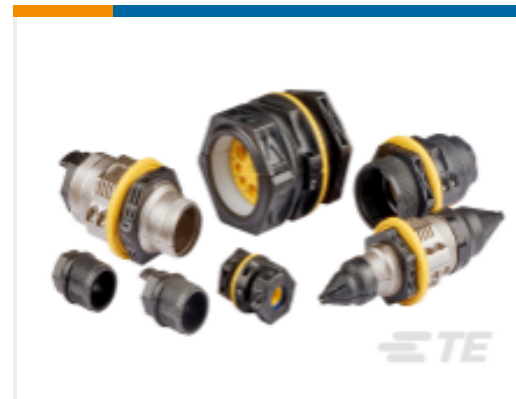
TE 产品编号ZPF00000000099321 D-EASY 03 B 03