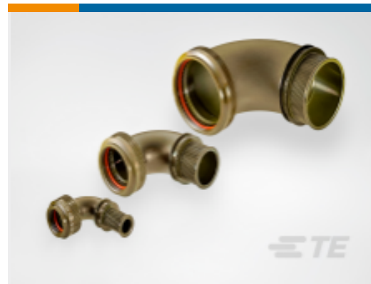
TE 产品编号BTA3-28-13-4-J BTA3-28-13-4-J