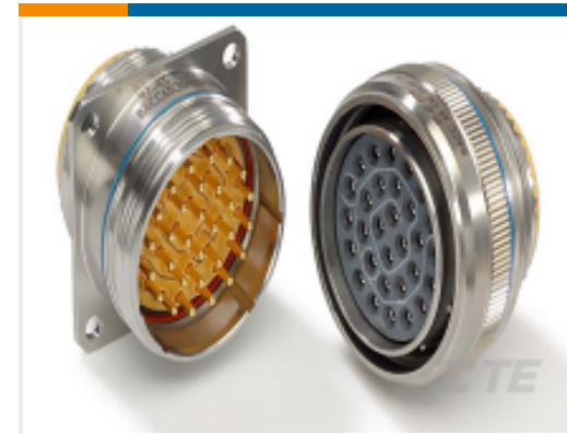
TE 产品编号ZPF00000000007288 983-ORS 22-39 SN-L