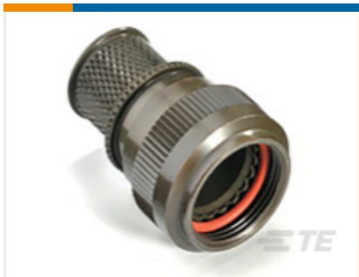
TE 产品编号BTA1-24-13-1-C BTA1-24-13-1-C