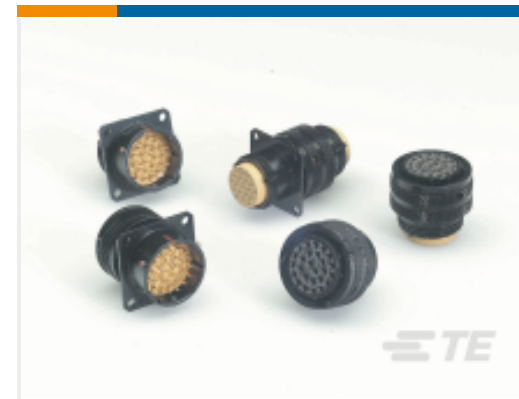
TE 产品编号ZPF00000000020071 FDBA 57-8-33 PN-K 090 A499