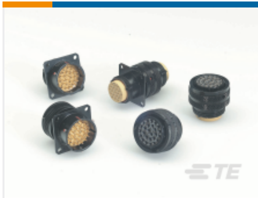
TE 产品编号ZPF00000000019852 FDBA 57-10-6 SW-K-A499