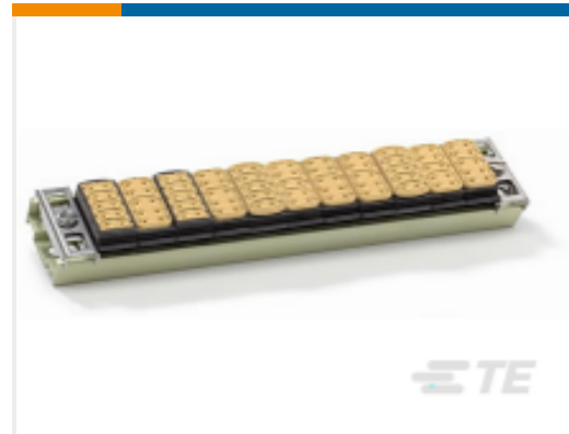
TE 产品编号ZPF00000000020126 FMJ 11A 20-04 G