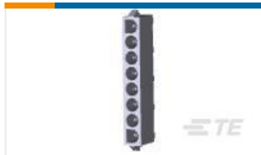
TE 产品编号641825-1 08P UMNL PIN HDR ASSY V2 NATL