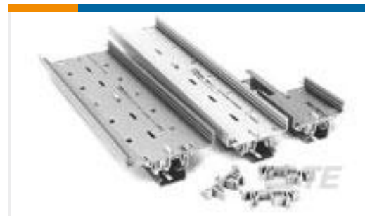
TE 产品编号6-1437685-4 8TK2-48=SNAP TRACK