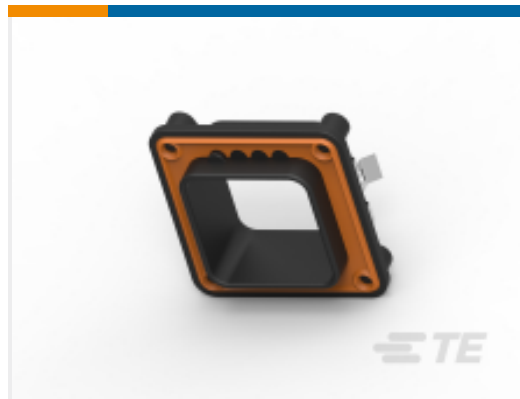
TE 产品编号DRBF-2A FLANGE, MOUNT, 60/48P, BLK, A