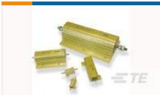
TE 产品编号8-1625999-2 HSC100 2K5 5%