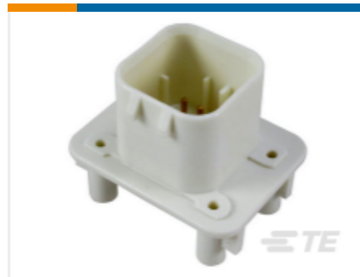
TE 产品编号1-776275-2 8POS,PIN DIA 1.3,HDR ASSY,180DEG, COD 2