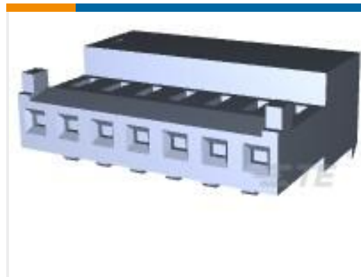
TE 产品编号3-643813-7 07P MTA100 CONN ASSY POL RIB