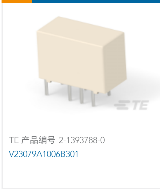
TE 产品编号 2-1393788-0 V23079A1006B301