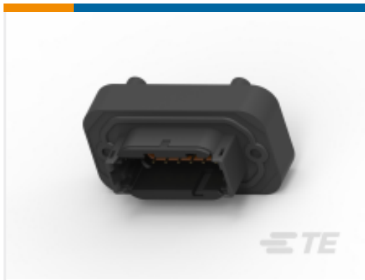
TE 产品编号DTM15-12PA HDR, 12P, GRY, ST, NI/CU, A