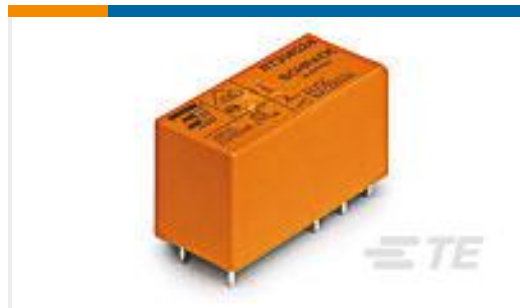
TE 产品编号9-1393243-2 RT425615