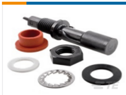
TE 产品编号80645-000 LS809-51 Liquid Level Sensor