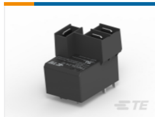
TE 产品编号1558676-6 T9GS1L24-22