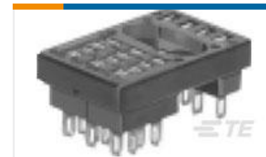
TE 产品编号 5-1393143-1 27E637=SOCKET,R10,4POLE,PCB,210