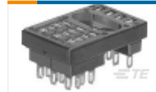
TE 产品编号 1-1393143-7 27E163=SOCKET,R10,16,SLG,PHE