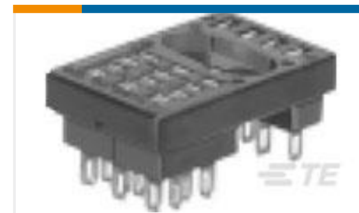
TE 产品编号 4-1393143-2 27E447=SOCKET,R10,4POLE,FLG-MNT,SOLDER