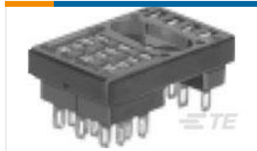
TE 产品编号 1-1393143-2 27E129=SOCKET,R10,16,PC,PHEN