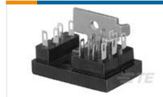
TE 产品编号 1-1393143-5 27E152=SOCKET,R10,ASSY,W/BRK