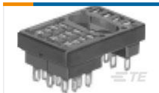
TE 产品编号 4-1393143-8 27E629=SOCKET,R10,4POLE,PCB,180