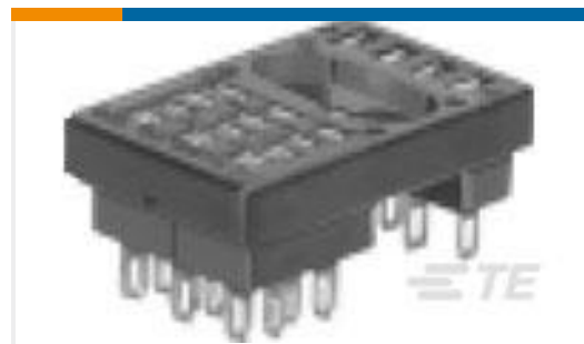
TE 产品编号 2-1393143-2 27E194=SOCKET,R10,16,PC,PHEN