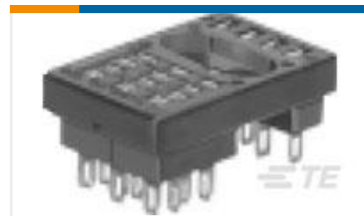
TE 产品编号 2-1393143-5 27E213=SOCKET,R10,16,PC,PHEN