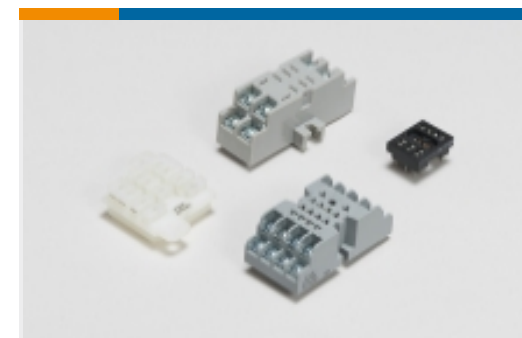
继电器附件、插座和卡箍(30)