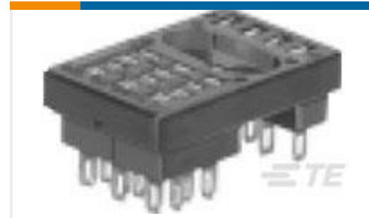
TE 产品编号 1393143-9 27E126=SOCKET,R10,16,SLG,PHE