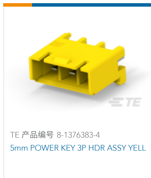
TE 产品编号 8-1376383-4 5mm POWER KEY 3P HDR ASSY YELL