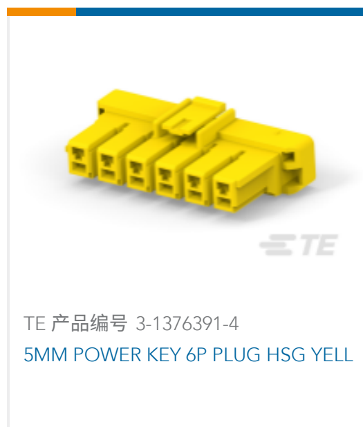
TE 产品编号 3-1376391-4 5MM POWER KEY 6P PLUG HSG YELL