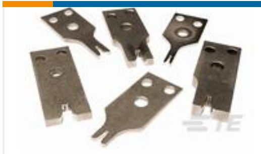
TE 产品编号1-456403-6 CRIMPER WIRE .062 F