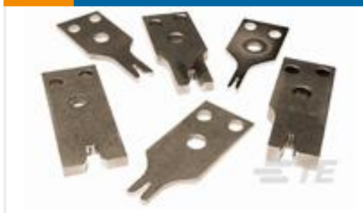
TE 产品编号1-913714-3 CRIMPER,INS