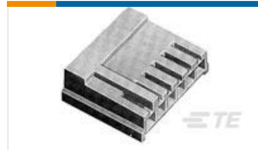
TE 产品编号171822-5 EIS REC. HSG 5P-NATURAL