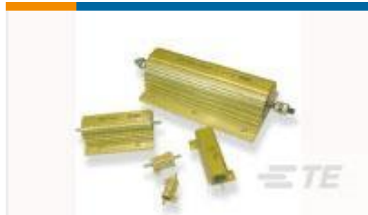
TE 产品编号1630019-8 HSC200 1K0 5%