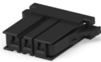
TE 产品编号 2-178128-3 DYNAMIC 3200 REC HSG 3P (SGL)