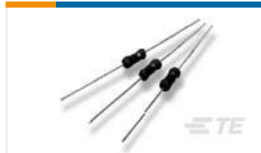
TE 产品编号2-1625892-1 3W SM M/OX 5% 1K0