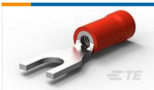
TE 产品编号171551-1 P.G SPADE