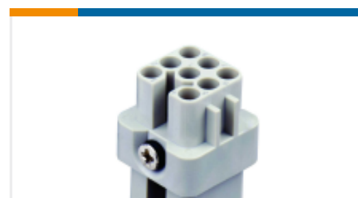
TE 产品编号T2020082201-000 HD-008-F