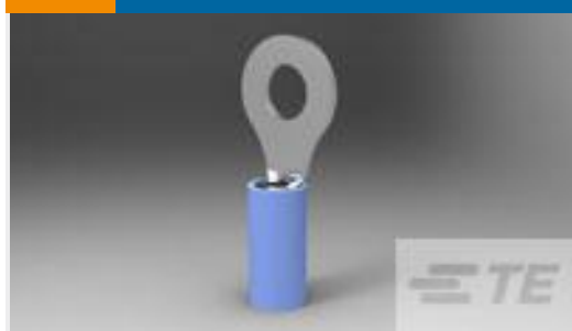
TE 产品编号321045 TERMINAL,PIDG R 16-14 1/4