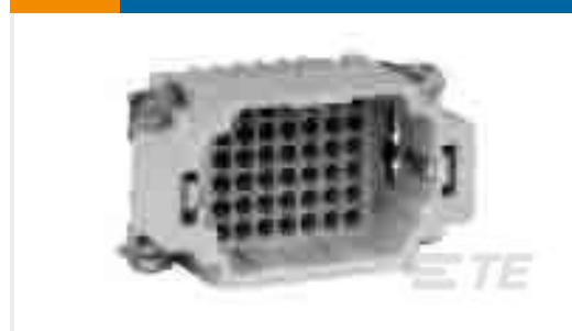
TE 产品编号2-1103204-3 HN.2D.42.STI.C