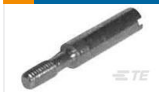
TE 产品编号1-1106101-1 F-BU-M3