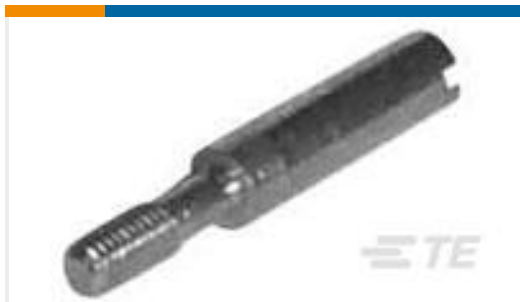
TE 产品编号1-1106102-1 F-STI-M3