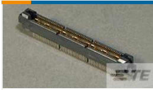
TE 产品编号5767055-3 MICT,R/APLUG,ASSY,114,PDNI