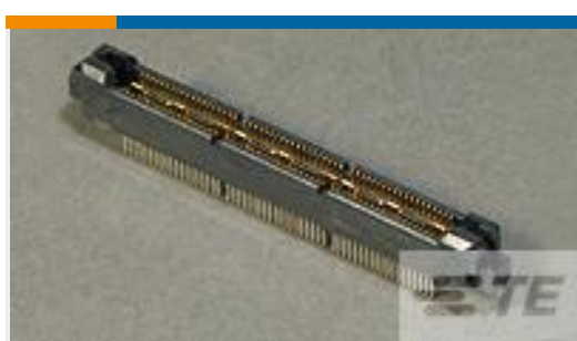
TE 产品编号5767055-3 MICT,R/APLUG,ASSY,114,PDNI