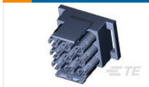
TE 产品编号2029370-1 09P UMNL-II REAR, TW-N-LK-CAP