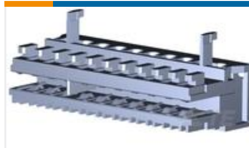
TE 产品编号7-1534796-0 AMP DUOPLUG MK2 CONNECTOR 10P