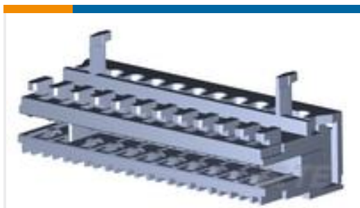
TE 产品编号4-1534797-1 AMP DUOPLUG MK2 CONNECTOR 11P