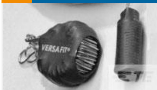
TE 产品编号938365P003 VERSAFIT-1/8-0-0.6IN-ST