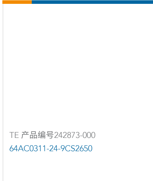
TE 产品编号242873-000 64AC0311-24-9CS2650