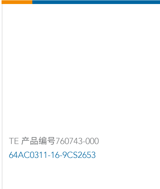
TE 产品编号760743-000 64AC0311-16-9CS2653