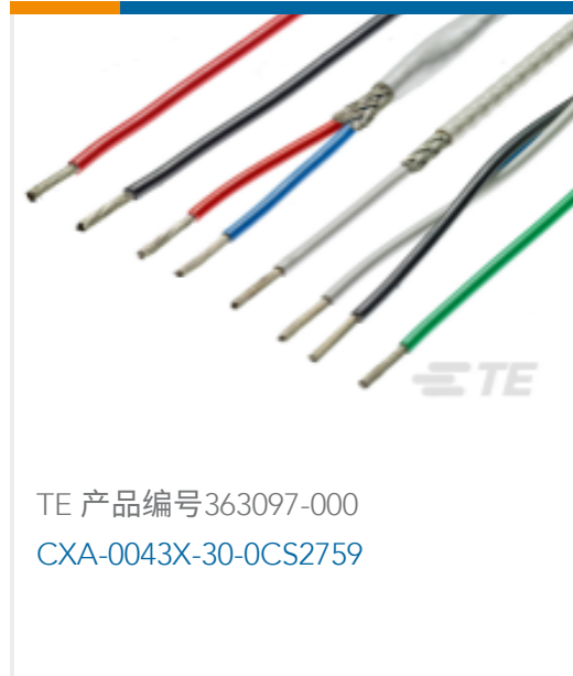
TE 产品编号363097-000 CXA-0043X-30-0CS2759