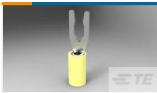
TE 产品编号52430-3 TERMINAL,PIDG SPR SPD 12-10 6