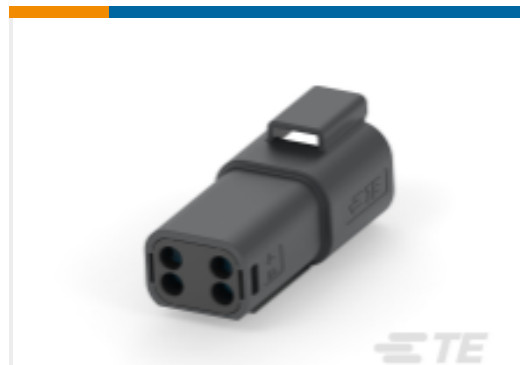
TE 产品编号1-2600030-0 4CCT BLACK RECFP W/LARGE SEAL