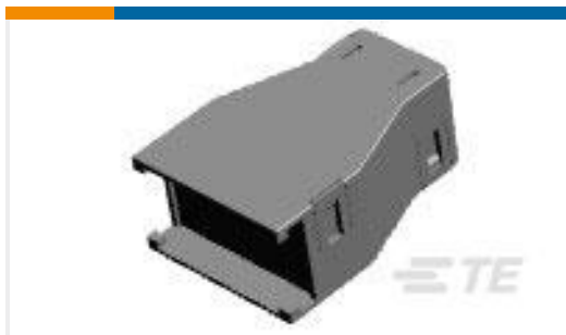
TE 产品编号1986185-1 Strain Relief,6 Posn,D5200 Dynamic, 2