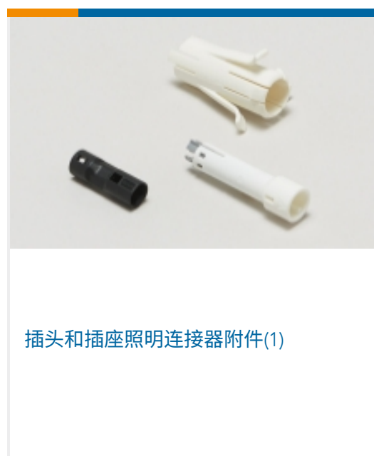
插头和插座照明连接器附件(1)