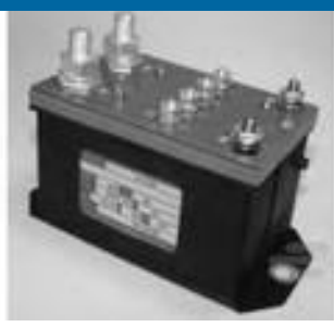
TE 产品编号1616058-6 A703CD (FAA/PMA)=RELAY