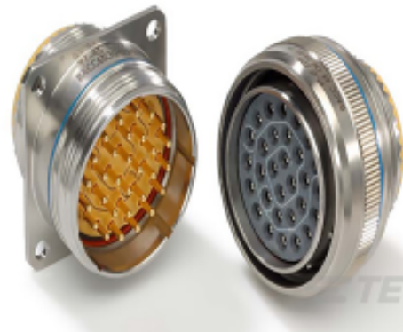
TE 产品编号358279-000 382C312-50-01-0