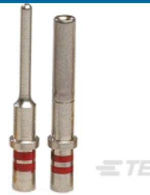
TE 产品编号ZPF000000000001261 097-0267-16 A1267