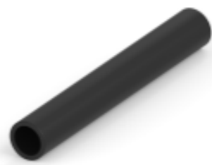
TE 产品编号CX1369-000 BSTS/BSTS-FR 热缩管