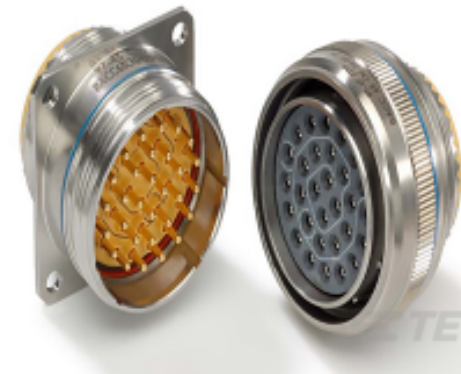
TE 产品编号ZPF0000000000007174 983-ORS 08-98 PN