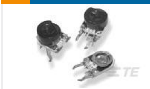
TE 产品编号1623893-1 416M 100R