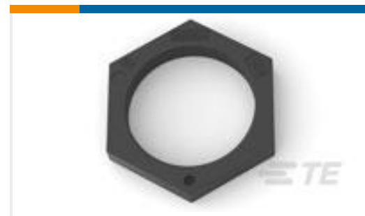
TE 产品编号293708-1 NECTOR M SCREW NUT 5,6,7P