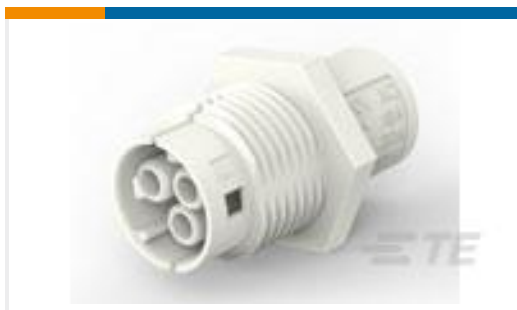
TE 产品编号293606-1 NECTOR M SKT HSG PANEL MOUNT CODE A