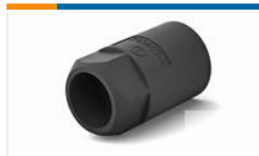
TE 产品编号1-293607-2 NECTOR M CABLE NUT DIA 9.0-9.9 MM