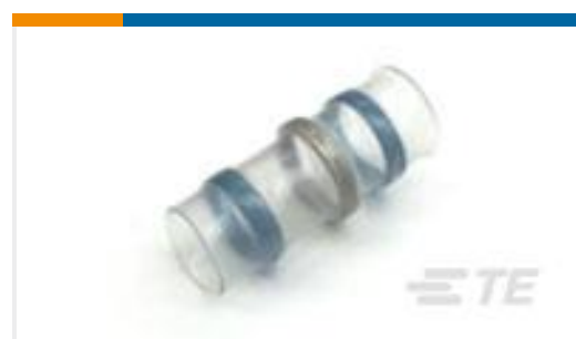
TE 产品编号114163-000 CWT-9003