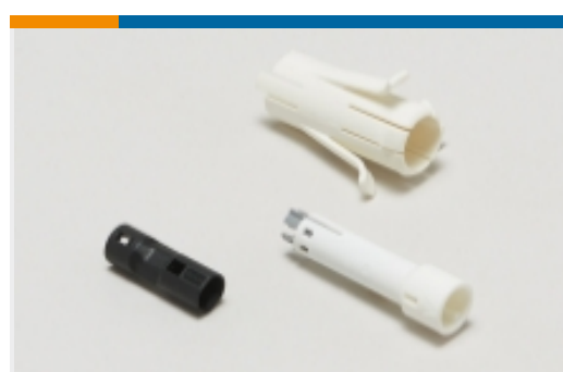
插头和插座照明连接器附件(57)