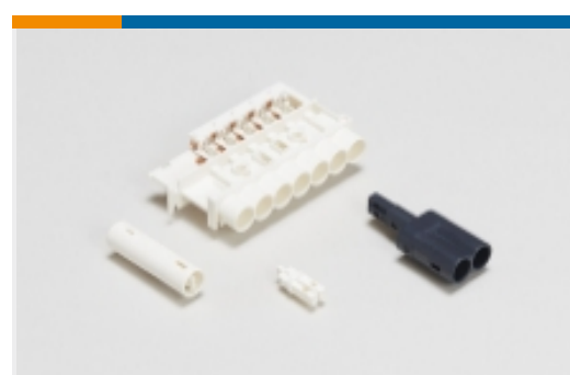
插头和插座照明连接器(54)