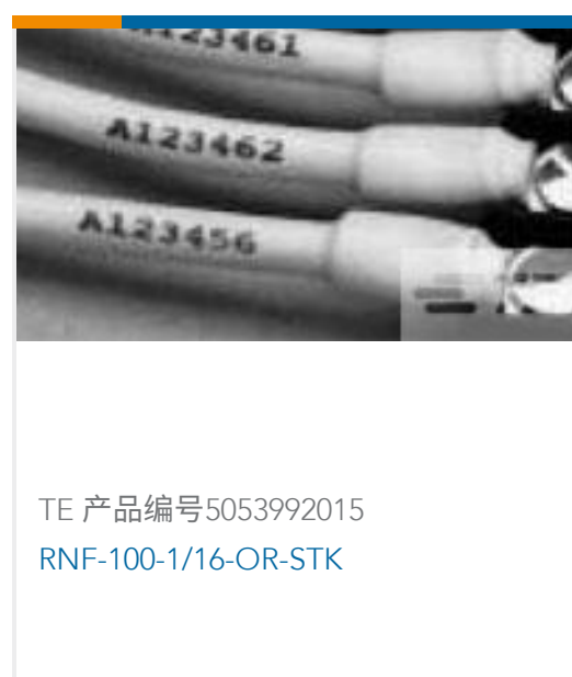
TE 产品编号5053992015 RNF-100-1/16-OR-STK