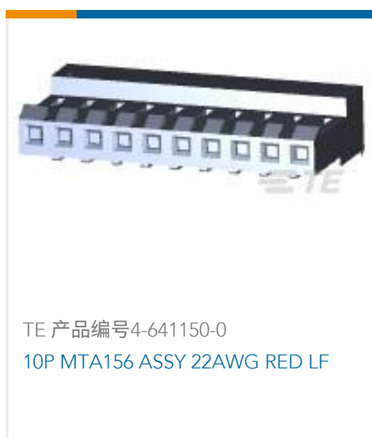
TE 产品编号4-641150-0 10P MTA156 ASSY 22AWG RED LF