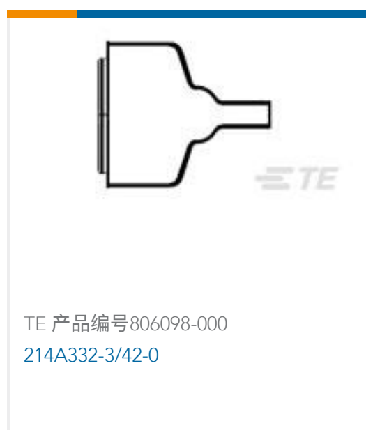
TE 产品编号806098-000 214A332-3/42-0