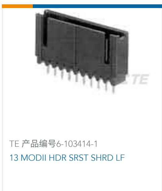
TE 产品编号6-103414-1 13 MODII HDR SRST SHRD LF