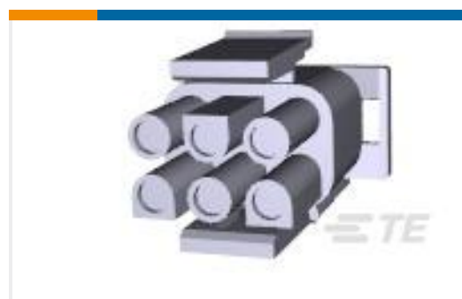
TE 产品编号1-480704-0 06P UMNL PLUG HSG NATL