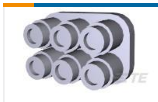
TE 产品编号794276-1 06P UMNL WIRE SEAL