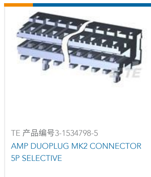
TE 产品编号3-1534798-5 AMP DUOPLUG MK2 CONNECTOR 5P SELECTIVE