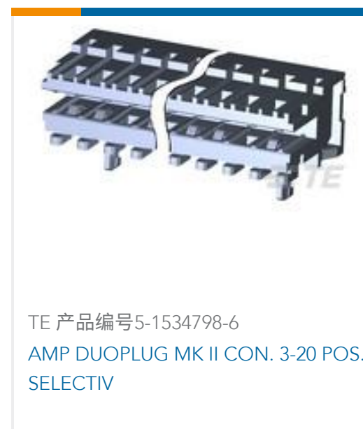
TE 产品编号5-1534798-6 AMP DUOPLUG MK II CON. 3-20 POS. SELECTIV