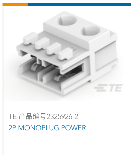
TE 产品编号2325926-2 2P MONOPLUG POWER