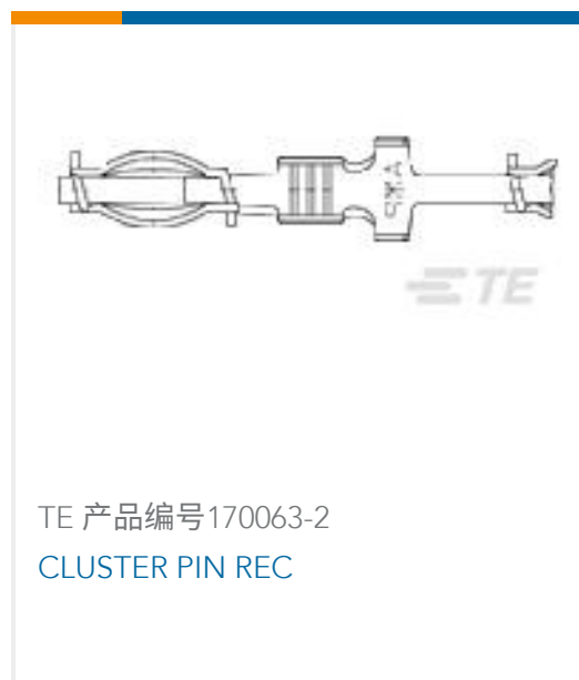
TE 产品编号170063-2 CLUSTER PIN REC