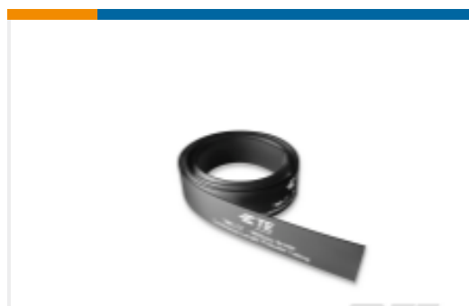
TE 产品编号ER2155-000 TMS-CT-50M-1-OUT-0