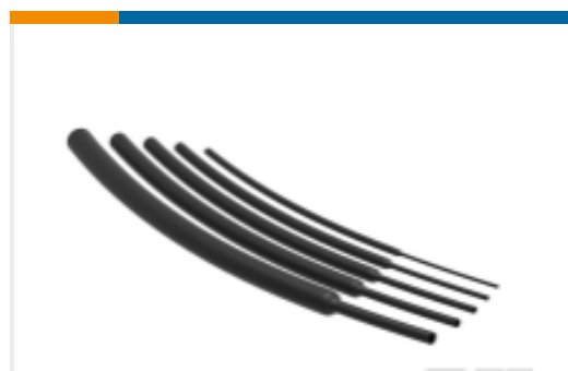
TE 产品编号NB18932001 RNF-100-1/4-BK-STK