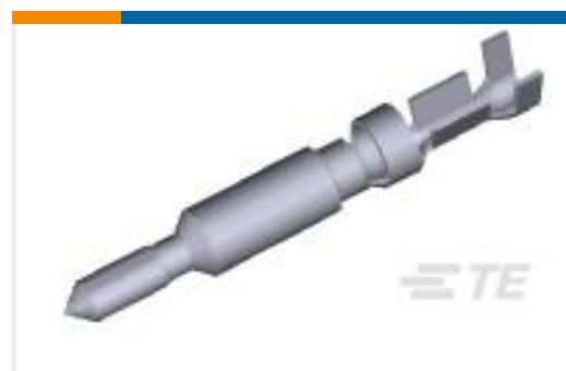
TE 产品编号770252-1 UMNL II PIN PTPBR LP 24-18