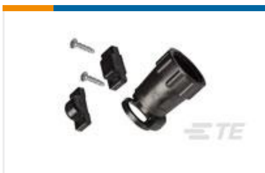
TE 产品编号206966-7 CABLE SHELL CLAMP SIZE 13