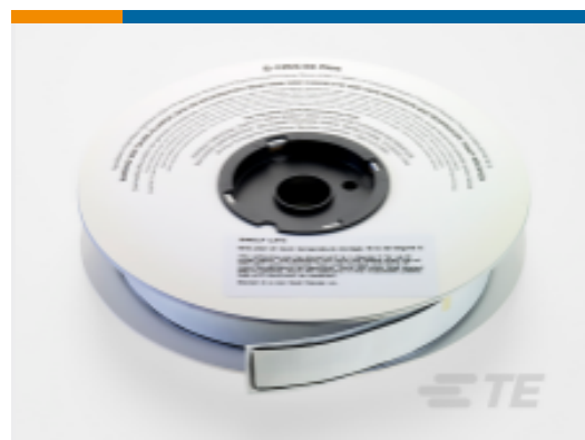
TE 产品编号 195133-000 S1255-04-3/4X100FT