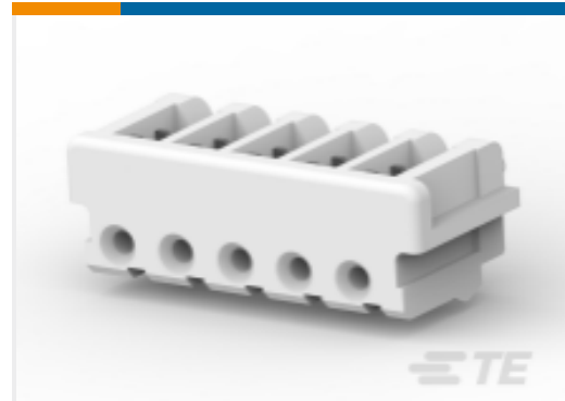
TE 产品编号 173977-5 CT CONN MT REC ASSY 5P