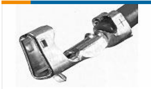
TE 产品编号 353918-1 CT 1.5MM REC CONT CRIMP TYPE