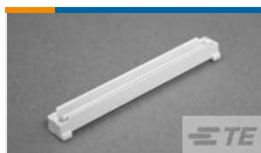
TE 产品编号5177984-6 0.8FH,P05H.5,140,08/Sn,TU