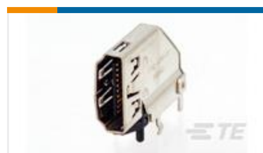
TE 产品编号2007435-3 Std HDMI, Flag, T/H