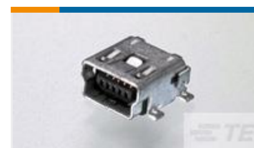
TE 产品编号1-1734035-2 MINI USB, TYPE B, R/A, SMT