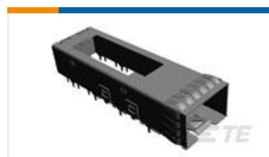
TE 产品编号2110304-1 SFP+ 1x1 Cage Assembly, Solder Tail