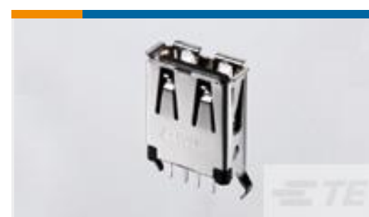
TE 产品编号1734366-3 Std USB Type A, VT, T/H, Blue