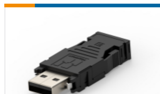
TE 产品编号 1827525-1 MECHATROLINK II CONNECTOR KIT