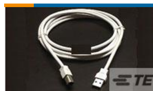
TE 产品编号 1487599-1 USB, A-BLUNT,28/28,BLK,0.83M