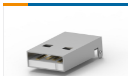
TE 产品编号 1-1734028-1 Std USB, Type A, Plug, Natural