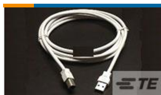
TE 产品编号 1487593-1 USB, A-BLUNT,28/24,WHT,2.0M