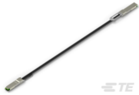
TE 产品编号2333393-7 QSFP 25GIG 30AWG 3 METER