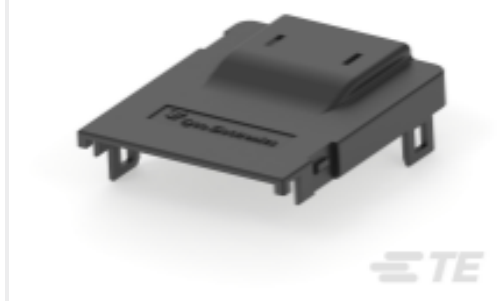
TE 产品编号1986186-1 Strain Relief,20 Posn,D3000 Dynamic, 2