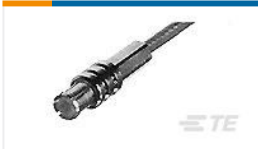
TE 产品编号1060875-2 MCX CABLE PLUG, CRIMP ATTACH