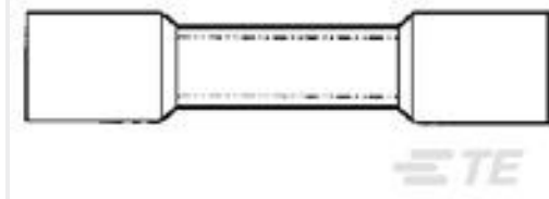
TE 产品编号55845-1 #8 PRE-INSUL SEALED SPLICE