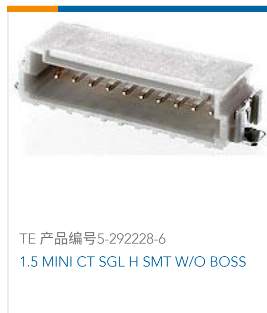
TE 产品编号5-292228-6 1.5 MINI CT SGL H SMT W/O BOSS