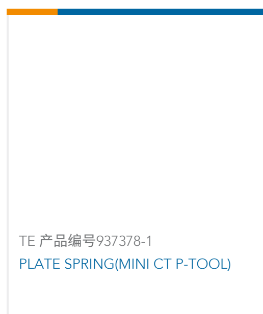
TE 产品编号937378-1 PLATE SPRING(MINI CT P-TOOL)