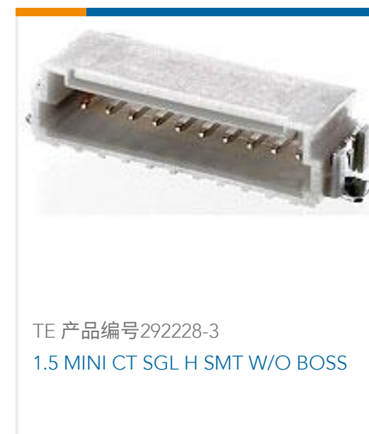
TE 产品编号292228-3 1.5 MINI CT SGL H SMT W/O BOSS