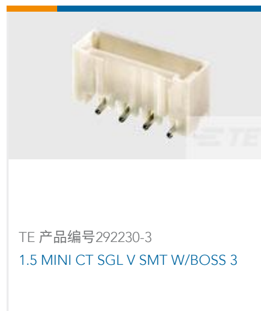
TE 产品编号292230-3 1.5 MINI CT SGL V SMT W/BOSS 3