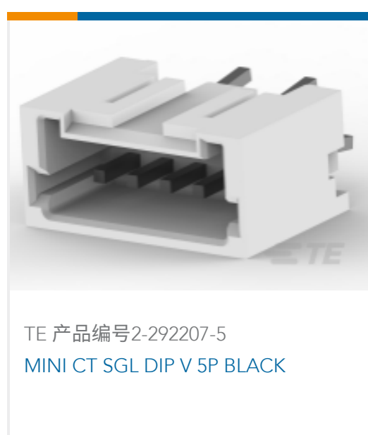
TE 产品编号2-292207-5 MINI CT SGL DIP V 5P BLACK