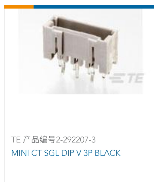
TE 产品编号2-292207-3 MINI CT SGL DIP V 3P BLACK