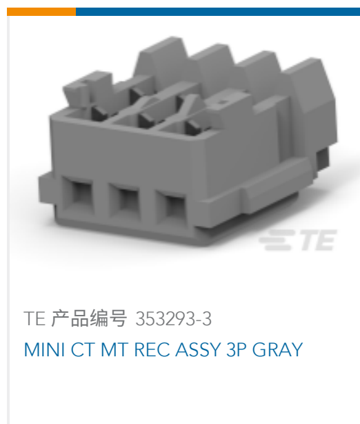
TE 产品编号 353293-3 MINI CT MT REC ASSY 3P GRAY