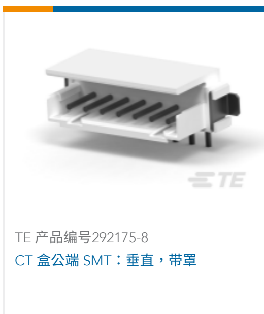
TE 产品编号292175-8 CT 盒公端 SMT: 垂直, 带罩