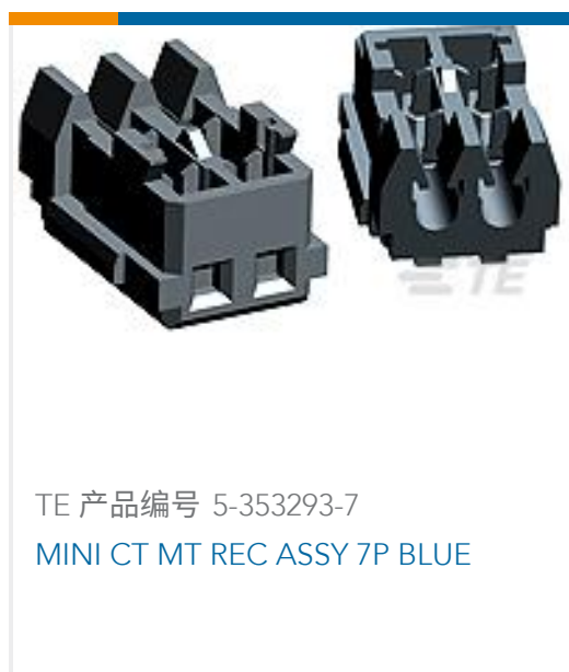
TE 产品编号 5-353293-7 MINI CT MT REC ASSY 7P BLUE