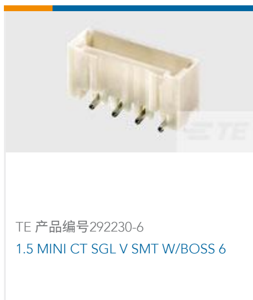
TE 产品编号292230-6 1.5 MINI CT SGL V SMT W/BOSS 6