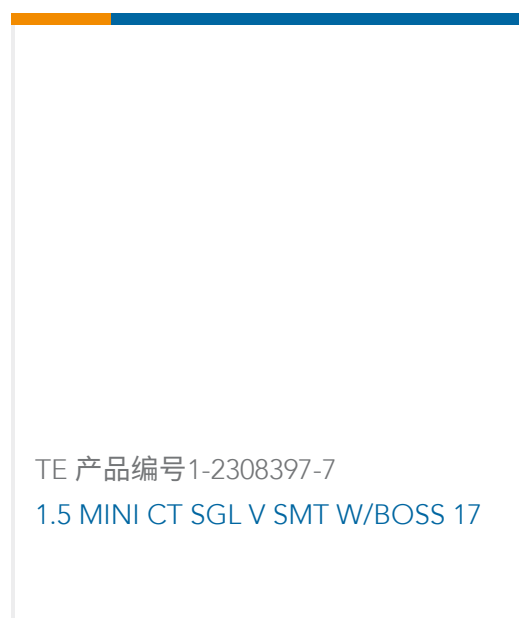
TE 产品编号1-2308397-7 1.5 MINI CT SGL V SMT W/BOSS 17