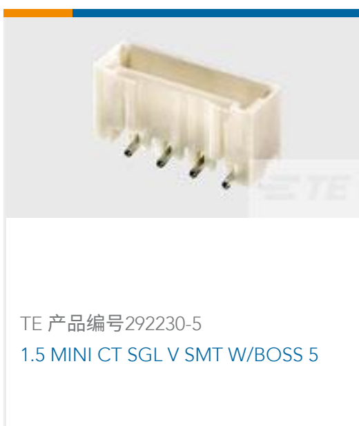
TE 产品编号292230-5 1.5 MINI CT SGL V SMT W/BOSS 5