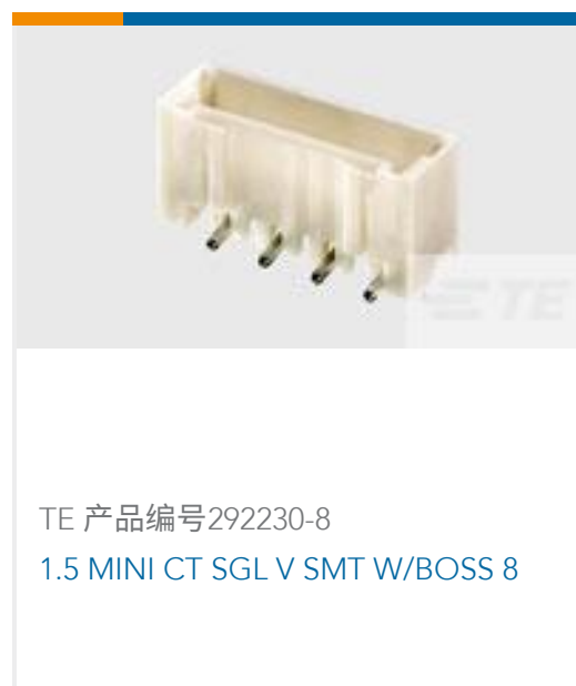
TE 产品编号292230-8 1.5 MINI CT SGL V SMT W/BOSS 8