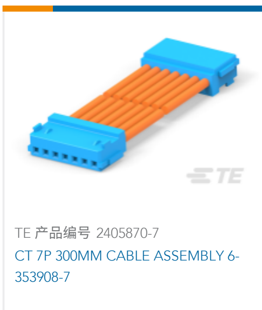
TE 产品编号 2405870-7 CT 7P 300MM CABLE ASSEMBLY 6-353908-7