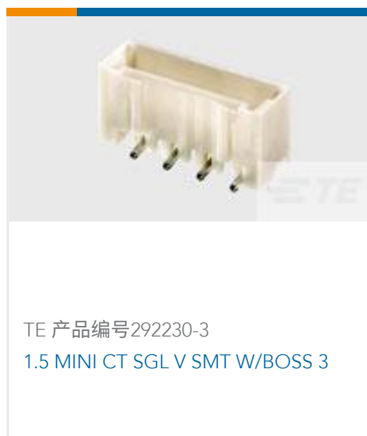
TE 产品编号292230-3 1.5 MINI CT SGL V SMT W/BOSS 3