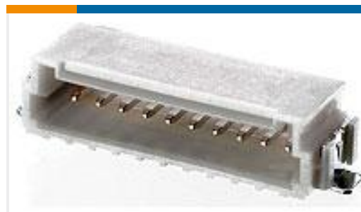
TE 产品编号6-292228-4 1.5 MINI CT SGL H SMT W/O BOSS