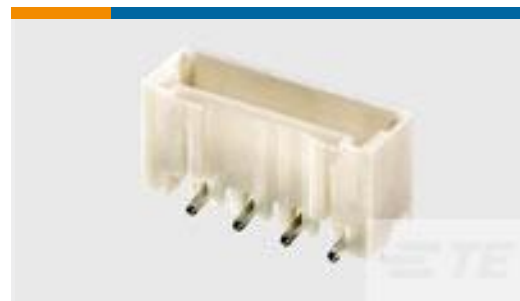
TE 产品编号292231-4 1.5 MINI CT SGL V SMT W/O BOSS