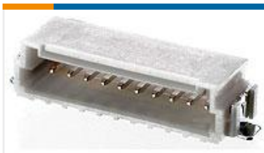
TE 产品编号292227-5 1.5 MINI CT SGL H SMT W BOSS 5