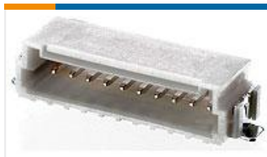
TE 产品编号292228-2 1.5 MINI CT SGL H SMT W/O BOSS