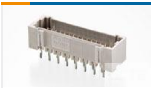
TE 产品编号4-292208-0 MINI CT D/R DIP 40P V NAT