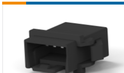
TE 产品编号2-292215-4 MINI CT SGL RELAY 4P BLACK