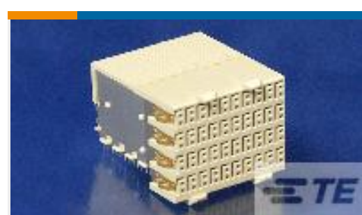
TE 产品编号2065657-1 zd Plus, 4 pair, receptacle assy