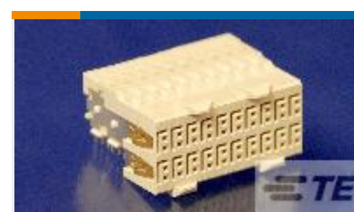
TE 产品编号6469028-1 HM-ZD 2PR RECP 40P