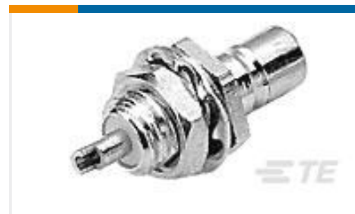
TE 产品编号1-1337480-0 SMB FM BHSkt 50Ohm Gold Pltd