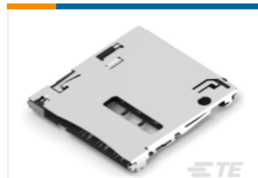
TE 产品编号2822541-1 PUSH-PUSH MICRO SIM CONNECTOR