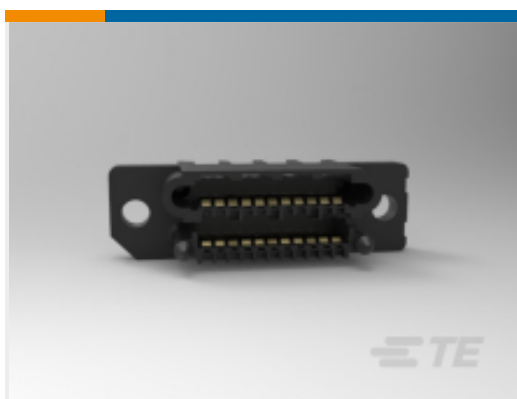
TE 产品编号 5-292178-1 MINI DRAWER CONN FOR CT 22P