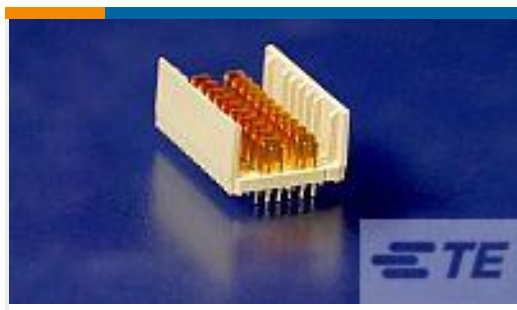
TE 产品编号6469025-1 HM-ZD 2PR HDR 40P 2.5MM