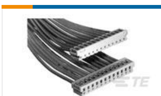
TE 产品编号1-179228-1 CT CRIMP-2 REC HSG 11P NATURAL