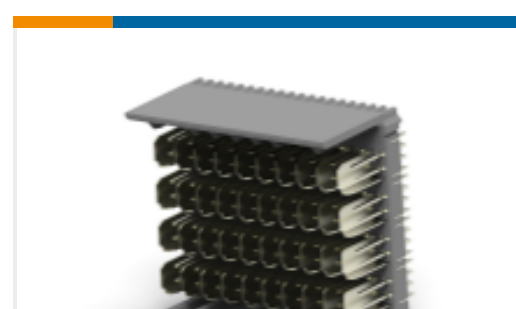
TE 产品编号2170330-1 HMZD+, 4PAIRS, 10COLS, VERTICAL, ASSEMBLY