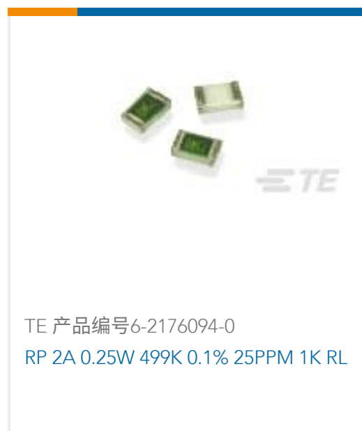
TE 产品编号6-2176094-0 RP 2A 0.25W 499K 0.1% 25PPM 1K RL