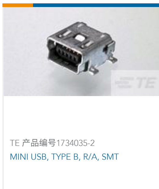
TE 产品编号1734035-2 MINI USB, TYPE B, R/A, SMT