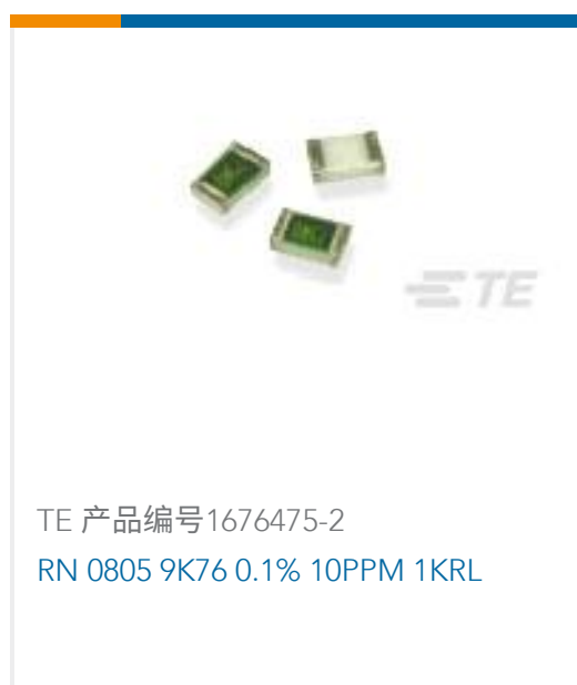
TE 产品编号1676475-2 RN 0805 9K76 0.1% 10PPM 1KRL