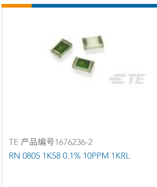
TE 产品编号1676236-2 RN 0805 1K58 0.1% 10PPM 1KRL