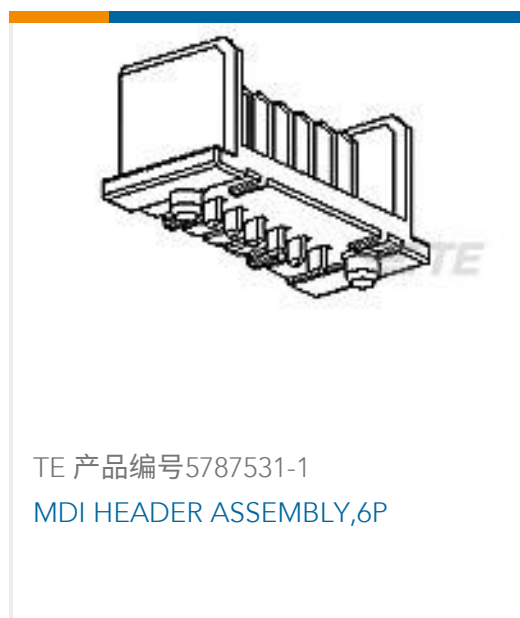
TE 产品编号5787531-1 MDI HEADER ASSEMBLY, 6P