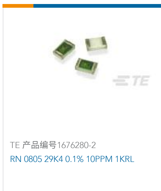
TE 产品编号1676280-2 RN 0805 29K4 0.1% 10PPM 1KRL