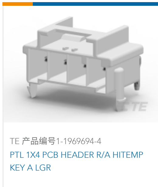
TE 产品编号1-1969694-4 PTL 1X4 PCB HEADER R/A HITEMP KEY A LGR