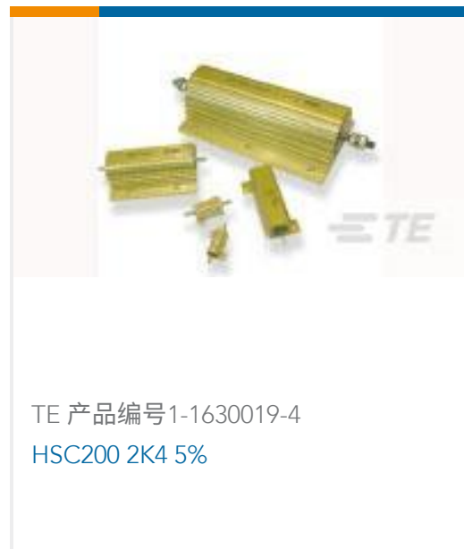
TE 产品编号1-1630019-4 HSC200 2K4 5%