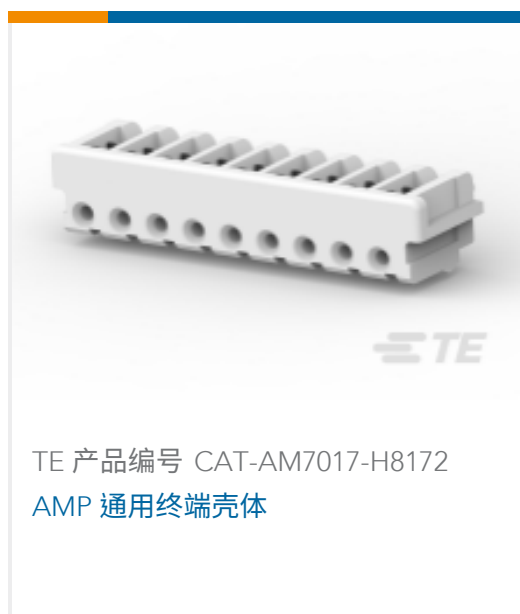
TE 产品编号 CAT-AM7017-H8172 AMP 通用终端壳体