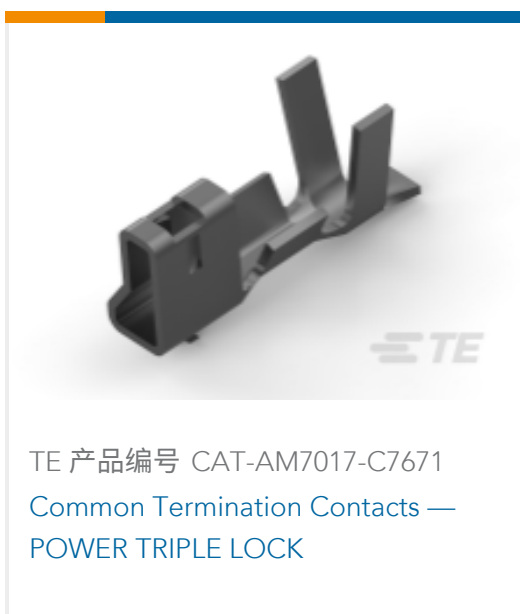
TE 产品编号 CAT-AM7017-C7671 Common Termination Contacts — POWER TRIPLE LOCK