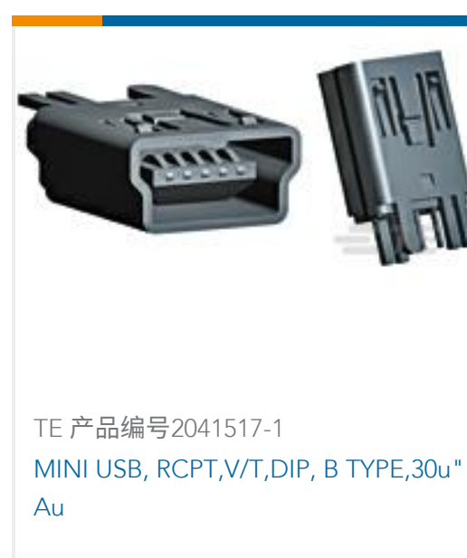
TE 产品编号2041517-1 MINI USB, RCPT, V/T, DIP, B TYPE, 30u" Au