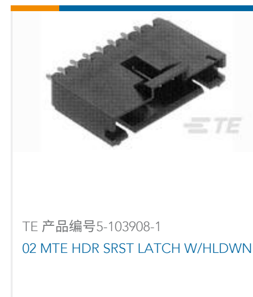
TE 产品编号5-103908-1 02 MTE HDR SRST LATCH W/HLDWN