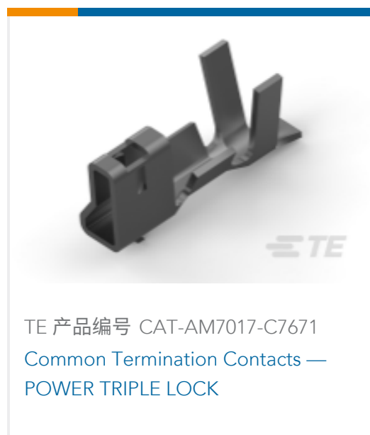
TE 产品编号 CAT-AM7017-C7671 Common Termination Contacts — POWER TRIPLE LOCK