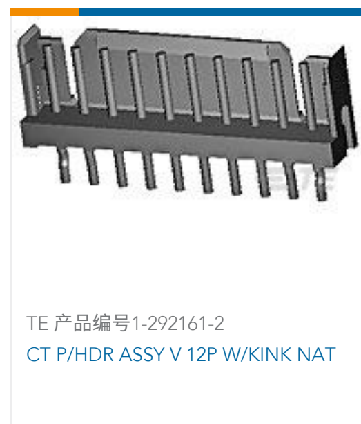
TE 产品编号1-292161-2 CT P/HDR ASSY V 12P W/KINK NAT