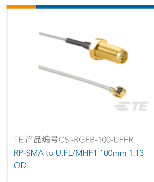
TE 产品编号CSI-RGFB-100-UFFR RP-SMA to U.FL/MHF1 100mm 1.13 OD