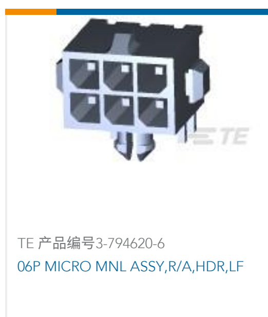
TE 产品编号3-794620-6 06P MICRO MNL ASSY, R/A, HDR, LF