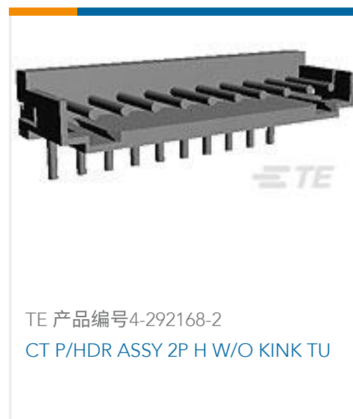
TE 产品编号4-292168-2 CT P/HDR ASSY 2P H W/O KINK TU