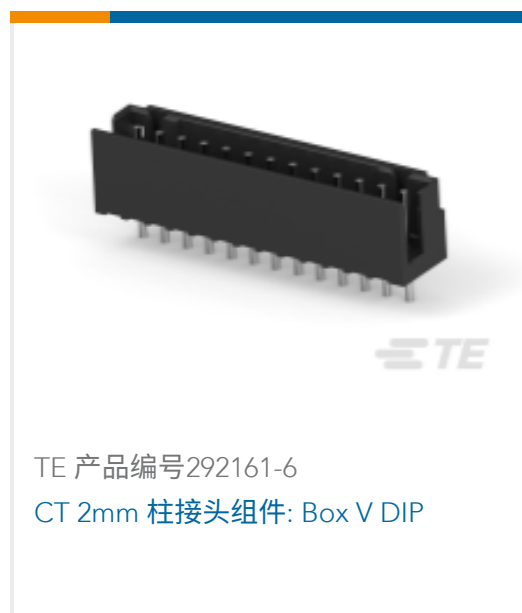
TE 产品编号292161-6 CT 2mm 柱接头组件: Box V DIP