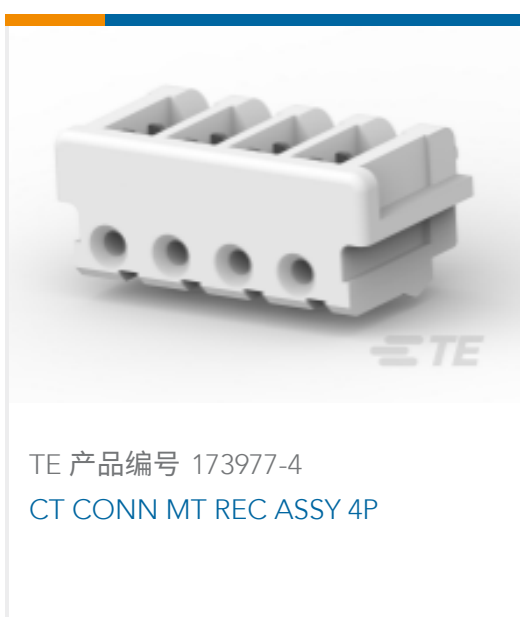
TE 产品编号 173977-4 CT CONN MT REC ASSY 4P