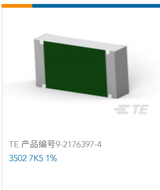
TE 产品编号9-2176397-4 3502 7K5 1%