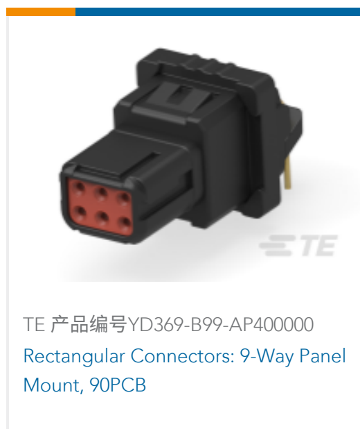
TE 产品编号YD369-B99-AP400000 Rectangular Connectors: 9-Way Panel Mount, 90PCB