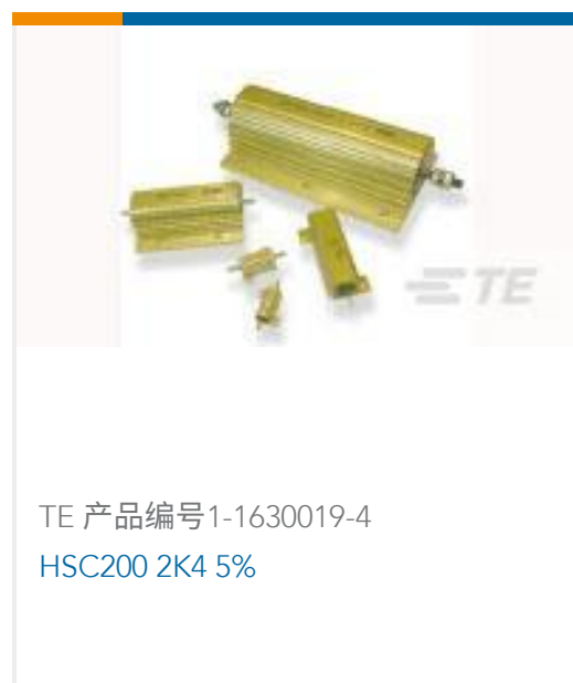
TE 产品编号1-1630019-4 HSC200 2K4 5%