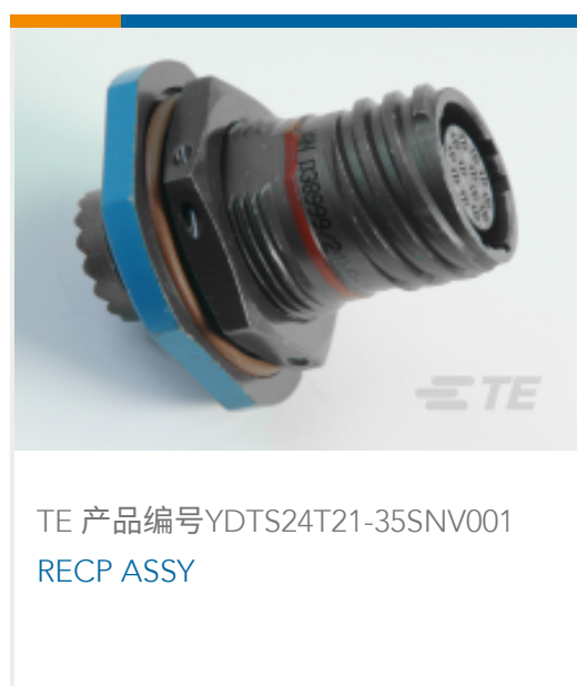
TE 产品编号YDTS24T21-35SNV001 RECP ASSY