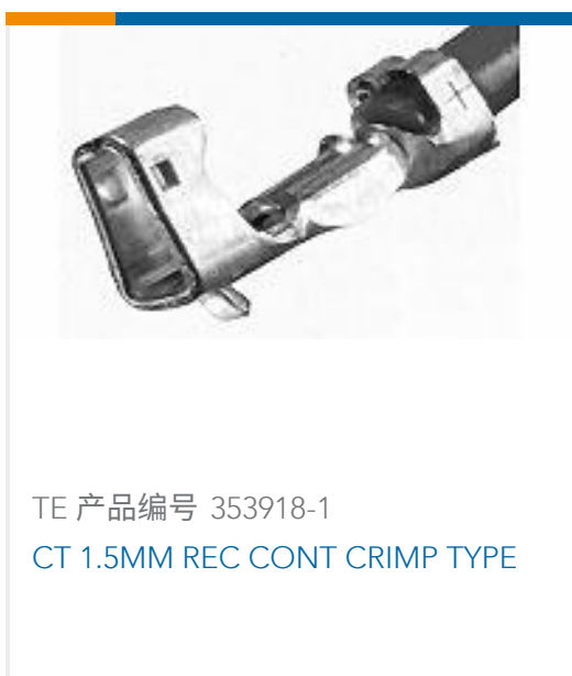
TE 产品编号 353918-1 CT 1.5MM REC CONT CRIMP TYPE