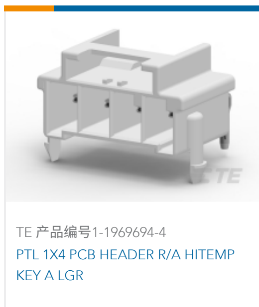
TE 产品编号1-1969694-4 PTL 1X4 PCB HEADER R/A HITEMP KEY A LGR