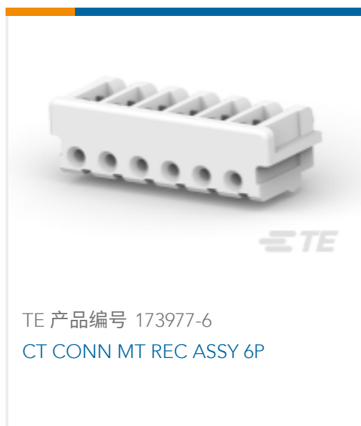
TE 产品编号 173977-6 CT CONN MT REC ASSY 6P