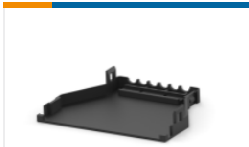
TE 产品编号1776695-1 Strain Relief, D5200, Dynamic