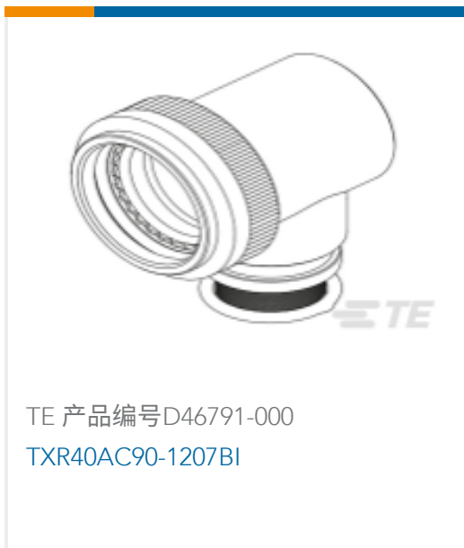
TE 产品编号D46791-000 TXR40AC90-1207BI