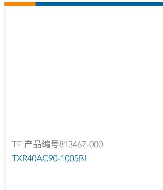
TE 产品编号813467-000 TXR40AC90-1005BI