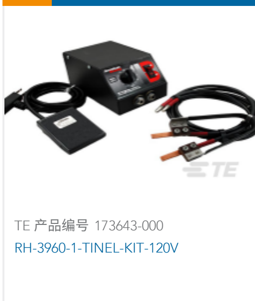
TE 产品编号 173643-000 RH-3960-1-TINEL-KIT-120V