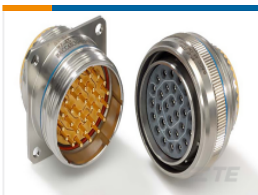
TE 产品编号ZPF00000000009091 983-6WS 08-03 SN