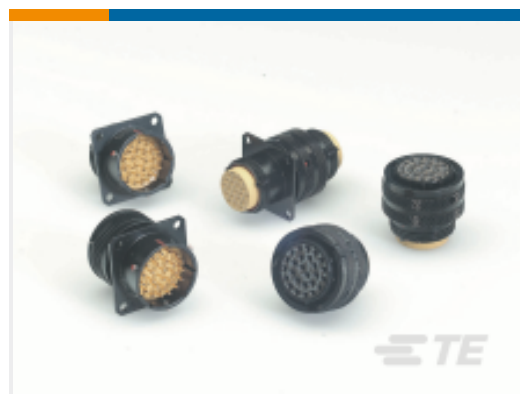
TE 产品编号ZPF00000000017900 FDDBA 50-10-6 PN-K