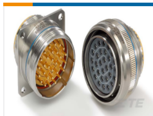
TE 产品编号ZPF000000000105746 983-6R 10-05 SN-A246