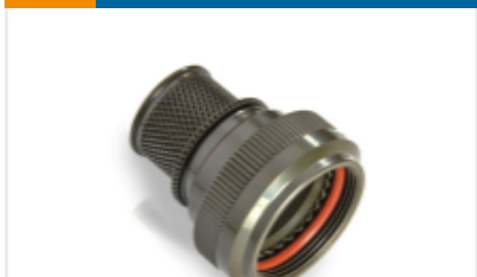
TE 产品编号EK4825-000 91H1-09-04-1-C-HE050