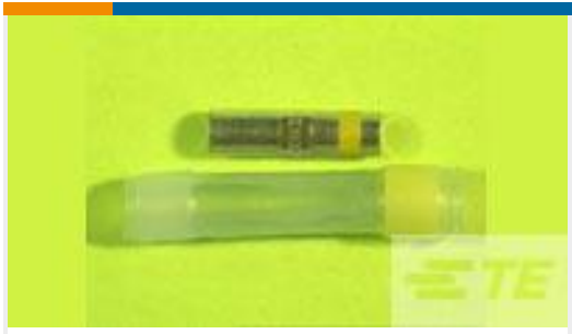
TE 产品编号650075-000 D-436-37