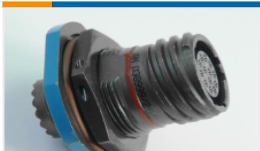
TE 产品编号YDTS24Z21-39SNV001 RECP ASSY