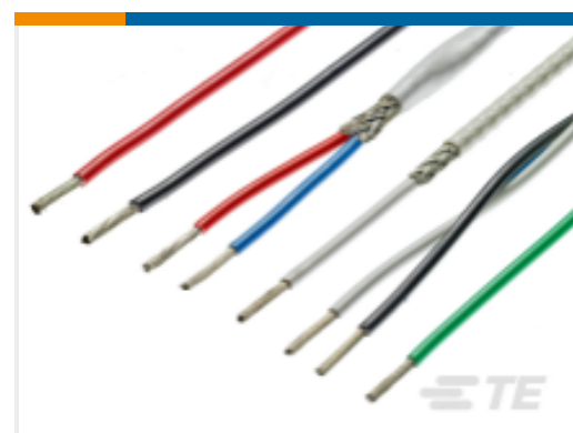
TE 产品编号2611473001 44A0111-12-54