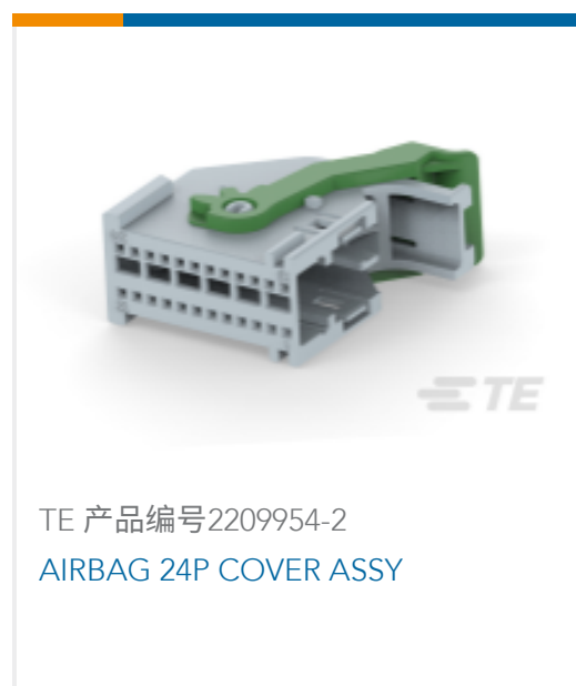
TE 产品编号2209954-2 AIRBAG 24P COVER ASSY