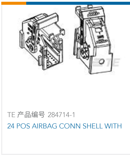
TE 产品编号 284714-1 24 POS AIRBAG CONN SHELL WITH