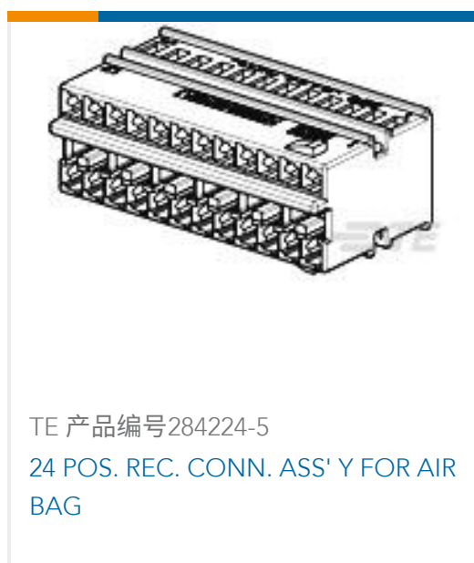
TE 产品编号284224-5 24 POS. REC. CONN. ASS'Y FOR AIR BAG