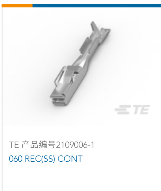
TE 产品编号2109006-1 060 REC(SS) CONT