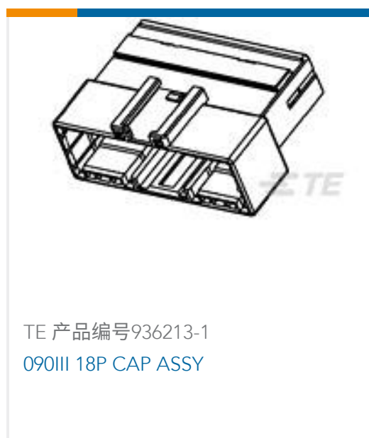
TE 产品编号936213-1 090III 18P CAP ASSY