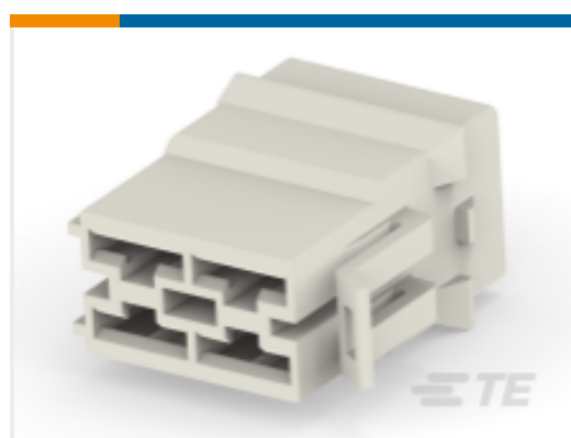
TE 产品编号235305-1 HOUSING 375 SRS FI/FO RECPT.