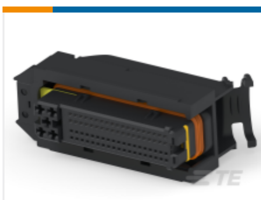
TE 产品编号1813712-9 81P ECU KIT