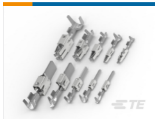
TE 产品编号964306-1 定时器,母端和公端