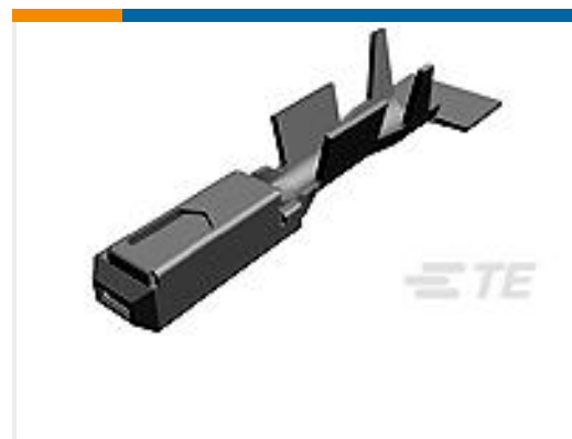
TE 产品编号5-1241608-1 MQS1,5 Sn rec CB unseal. 0,75-1,5