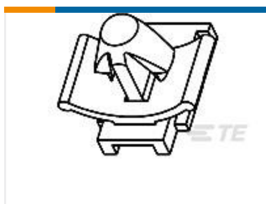
TE 产品编号368260-1 CLIP HSG FOR 090 II MLC