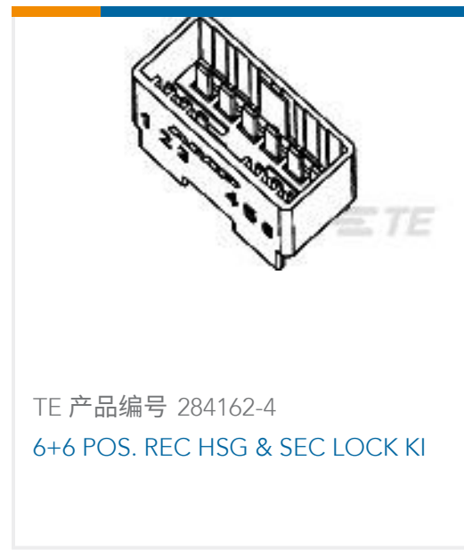
TE 产品编号 284162-4 6+6 POS. REC HSG & SEC LOCK KI