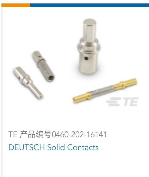
TE 产品编号 0460-202-16141 DEUTSCH Solid Contacts