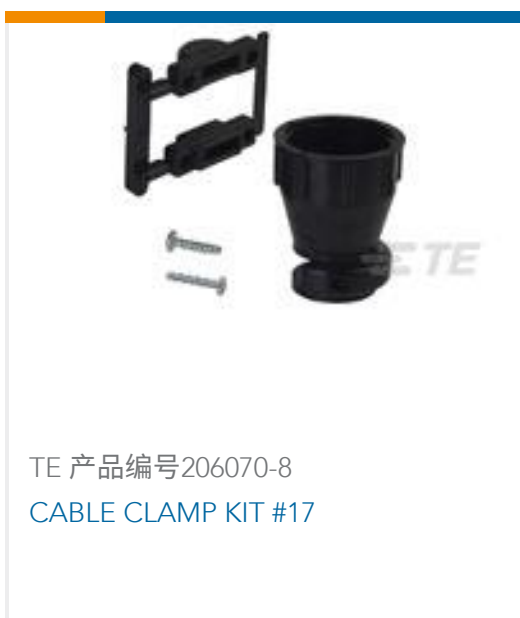
TE 产品编号 206070-8 CABLE CLAMP KIT #17