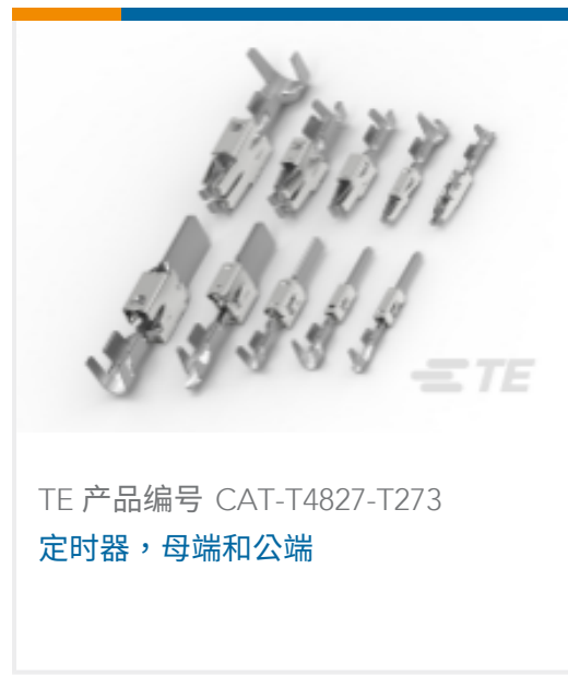
TE 产品编号 CAT-T4827-T273 定时器, 母端和公端