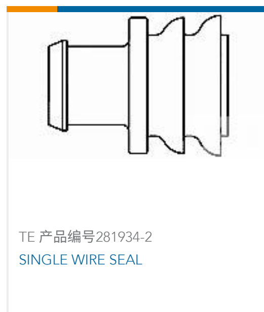
TE 产品编号 281934-2 SINGLE WIRE SEAL