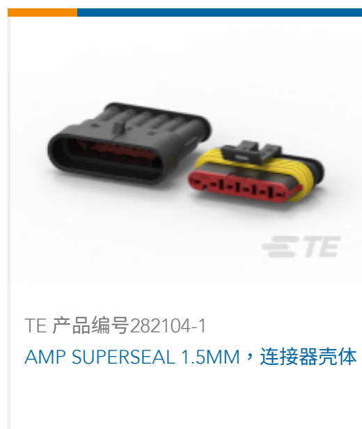
TE 产品编号 282104-1 AMP SUPERSEAL 1.5MM, 连接器壳体