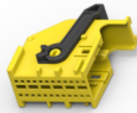
TE 产品编号1-1534704-5 COVER ASSY 24POL