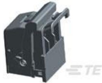
TE 产品编号284438-1 FRAME 36 POS. ASSY 3 CONN CRIM