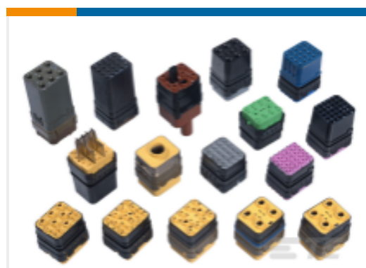
TE 产品编号ZPF00000000148762 DMC-M 99-04 AN (=33537-P0000)