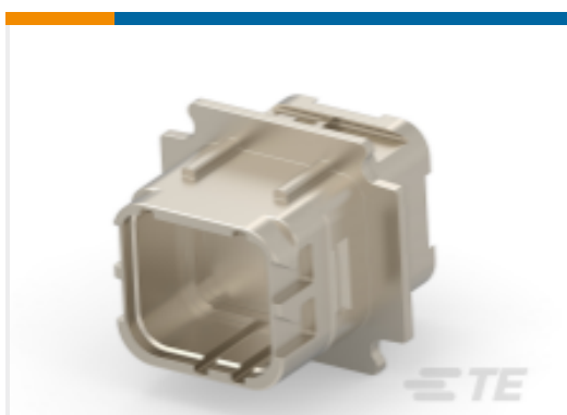
TE 产品编号ZPF00000000146309 Rectangular Connector Receptacle Extenders, Tool-less Assembly